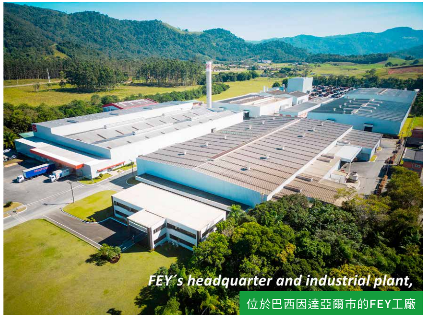
FEY's headquarter and industrial plant,

FEY 的年收入為 5 億巴西幣，其中 8% 來自出口，生產能力為每月 3,200 噸，擁有 750 多名員工。除了已經鞏固的產品陣容外，該公司還發展出客製化項目，特別是為大型汽車製造商和農機具等客戶開發客製化項目，這一戰略旨在為其產品增加更多價值。此外，該公司還涉足經銷領域、售後市場和其他銷售渠道。