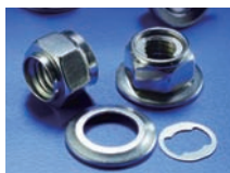
Patent No. M443789

產品特色：安全防鬆螺帽，一般螺帽因本體未沖壓固定有墊圈及華司，防鬆效果有限，本產品藉由墊圈之卡墊部卡持及華司之迫緊定位，提升鎖固防鬆之功效。