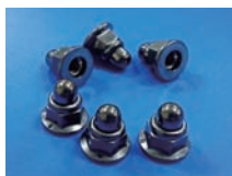
German Utility Model