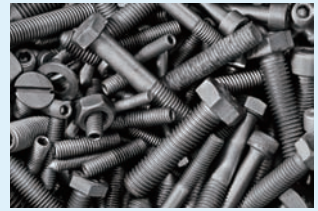
台湾2018年1-6月螺丝类产品(含钢铁钉)出口统计(逐月)

今年上半年,台湾螺丝外销表现可说是非常亮眼,不论是出口量、出口价与出口值,都创下有史以来同期「新三高」。累计至今年1~6月,螺丝出口量总计83,0299吨,比去年同期成长5.65%,出口平均价格为2.866美元/公斤,比去年同期增长10.63%,出口金额为23.7996亿美元,也大幅提升16.89%。去年以来,因欧美经济成长、国外市场需求增加,加上钢价走高,中钢跟著上调棒线盘价,因而带动螺丝外销缔造如此亮眼的业绩,今年全年外销有机会再创新高。